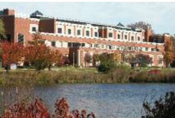
Rider (Sweigart Hall)

It's my first time in the US but I don't feel disoriented. Nevertheless, everything is not the same overseas. San Francisco State offers a wide range of classes in different colleges; therefore you can meet many different people with different backgrounds. It's also the case in the IEEC (international Education Exchange Council), that we, as exchange students, are part of. We can attend events, do visits, play intramural sports and meet Americans as well as other foreigners.